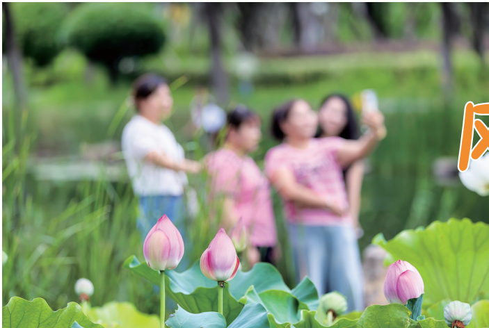
“荷”你同框