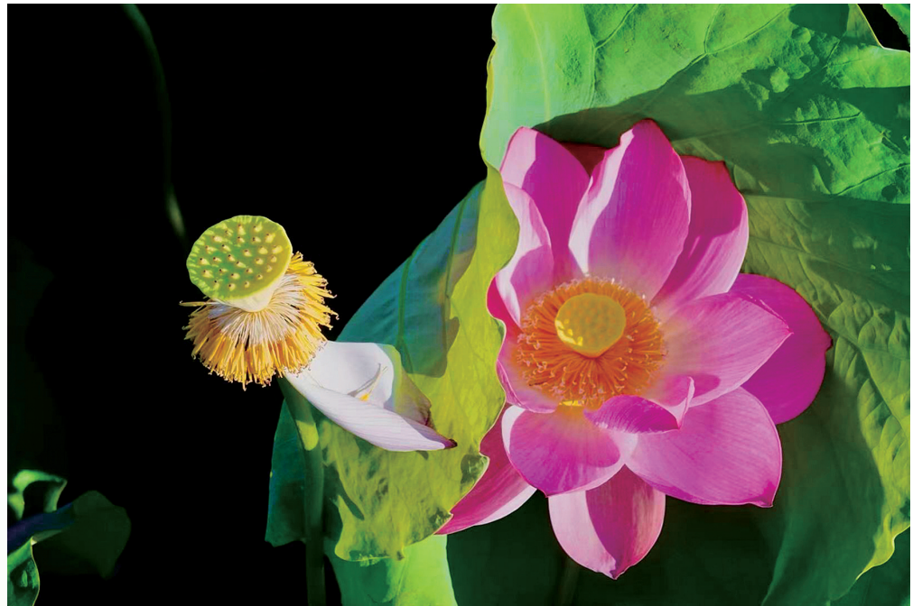
残红相守不离弃