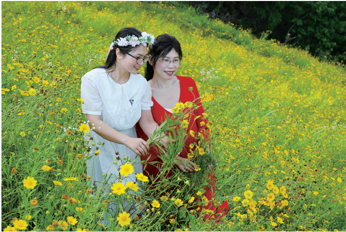
花艳人美