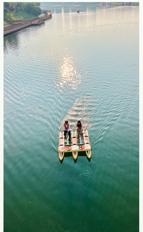
浪漫骑“游”