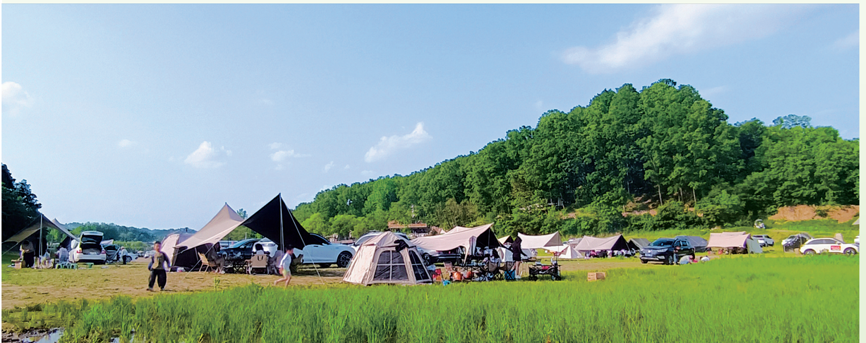
露营山野好消息