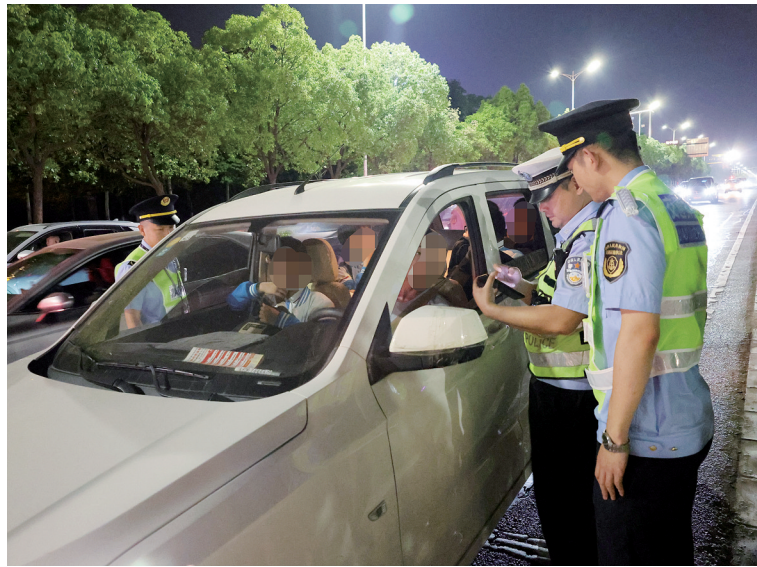
严查无证无照、证照不全等非法运输行为

此次联合执法行动出动执法人员93人次、车辆26台次,查处非法营运车辆3台、超限货车1辆、违规大件运输货车2辆,现场整改违法行为6起,同步对相关当事人开展批评教育,涉案车辆均依法处置。