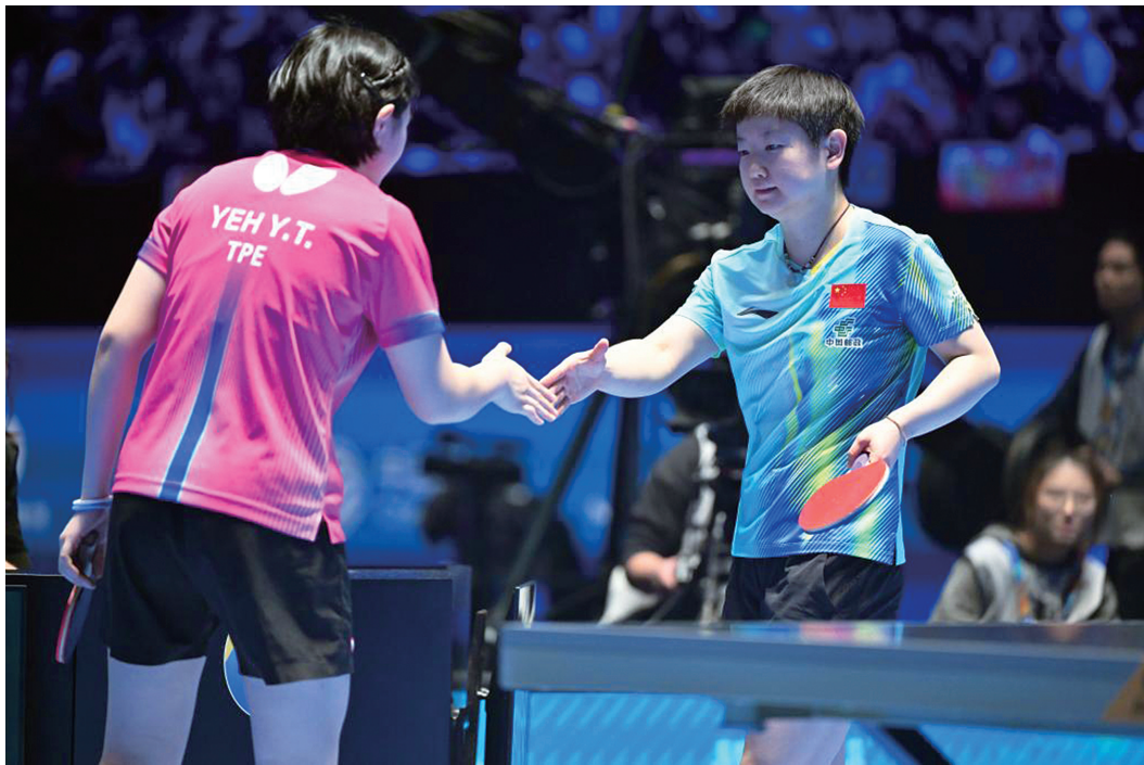
2月4日,孙颖莎(右)在比赛后与叶伊恬握手。

第35届国际乒联-亚乒联盟亚洲杯4日在海口结束小组赛首日争夺。孙颖莎、王楚钦在伤愈后复出国际赛场,迎来“开门红”,国乒其他队员也均取得首胜。