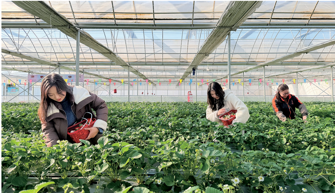
近日,记者在浉河区十三里桥乡学堂岗精品草莓园看到,红彤彤的草莓散发着诱人的芳香,等待采摘进入市场。据了解,这里的草莓采用高垄种植的方式,无须弯腰便可轻松采摘,采摘期一般从11月开始可以一直持续到次年5月上旬。

清冰除雪,拼的是速度,更是责任。目前,主次干道通行顺畅,背街小巷加速“解冻”。群众脚下的路,正一步步变得安全、洁净。