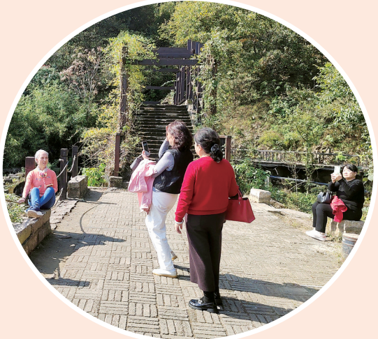
休闲打卡