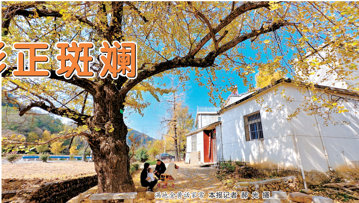
满地金黄话家常

初冬时节,豫南大地层林尽染。大别山山山水水秋韵尚存,冬意初显,满眼都是别样的美丽。 看,人们迎着暖阳,有骑行的、有郊游的、有赏景打卡的、有跳舞的,他们以不同的形式放松身心,享受着生活的多彩和浪漫。在南湾湖畔、鸡公山、茶山、郝堂、公园……冬日茶乡宛如一幅徐徐展开的色彩画,引人赞叹。 本报记者 王红霞 整理