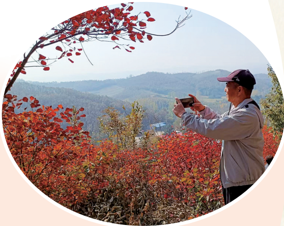
叶红成景