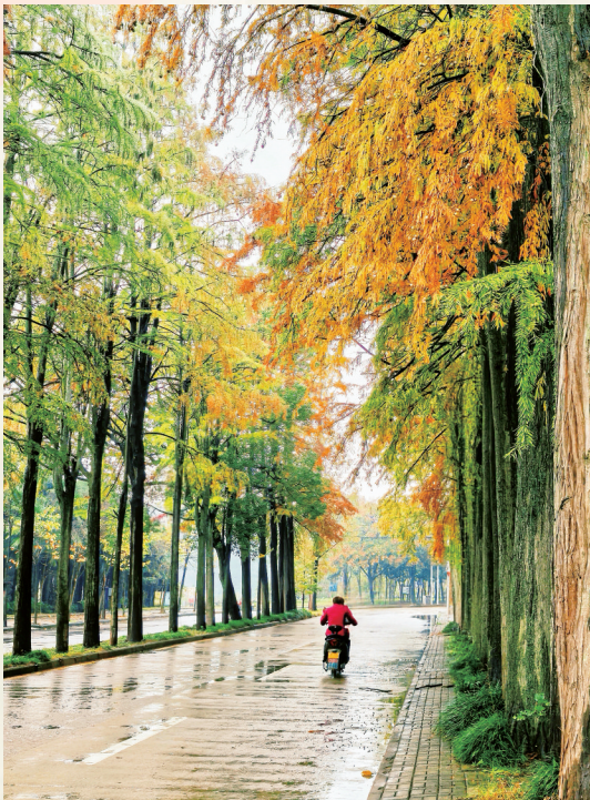
冬杉如画 魏志文 摄