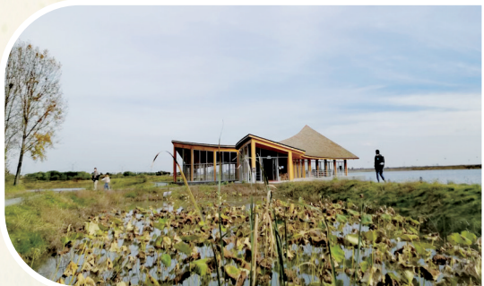
冬日残荷 本报记者 徐杰 摄