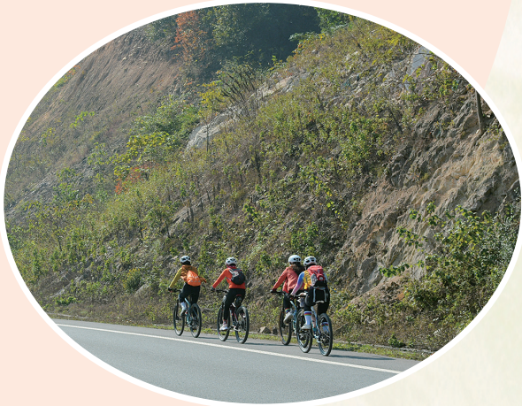
郊外畅行