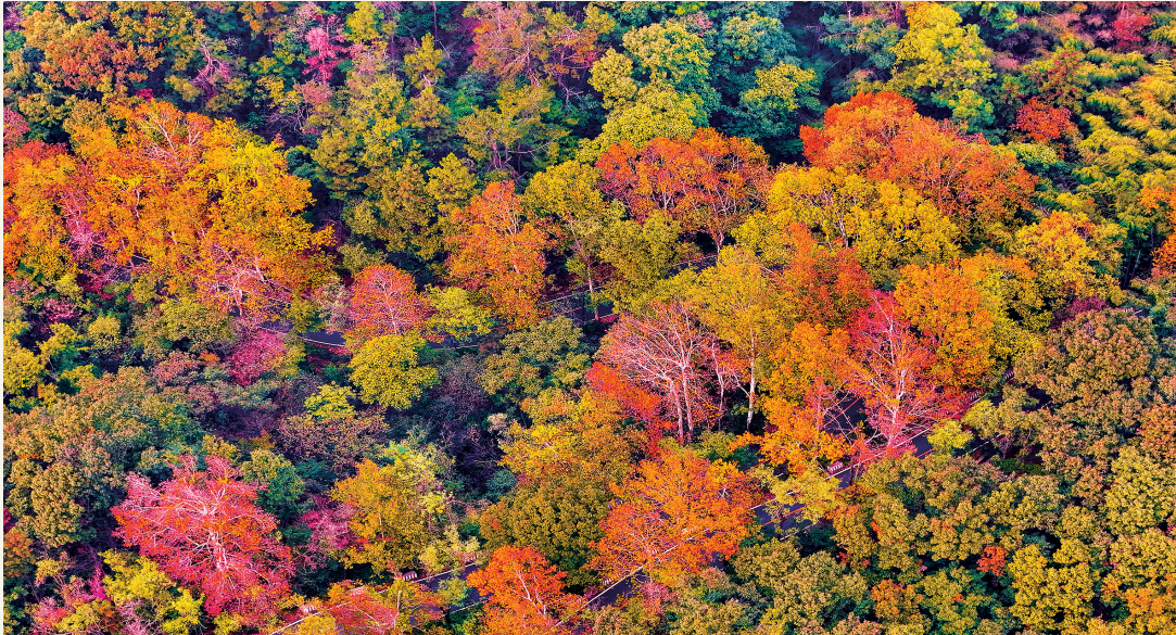
色彩斑斓