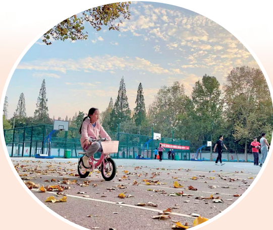
惬意时光