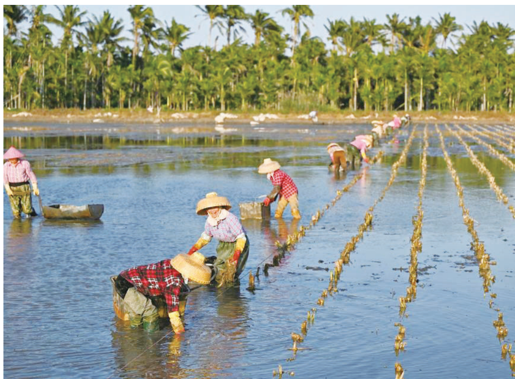
12月18日，农民在海口市琼山区七水洋蔬菜种植基地种植茭白。近日，海南进入冬季瓜菜种植和采收的旺季，田间地头到处是农民们劳作的身影。