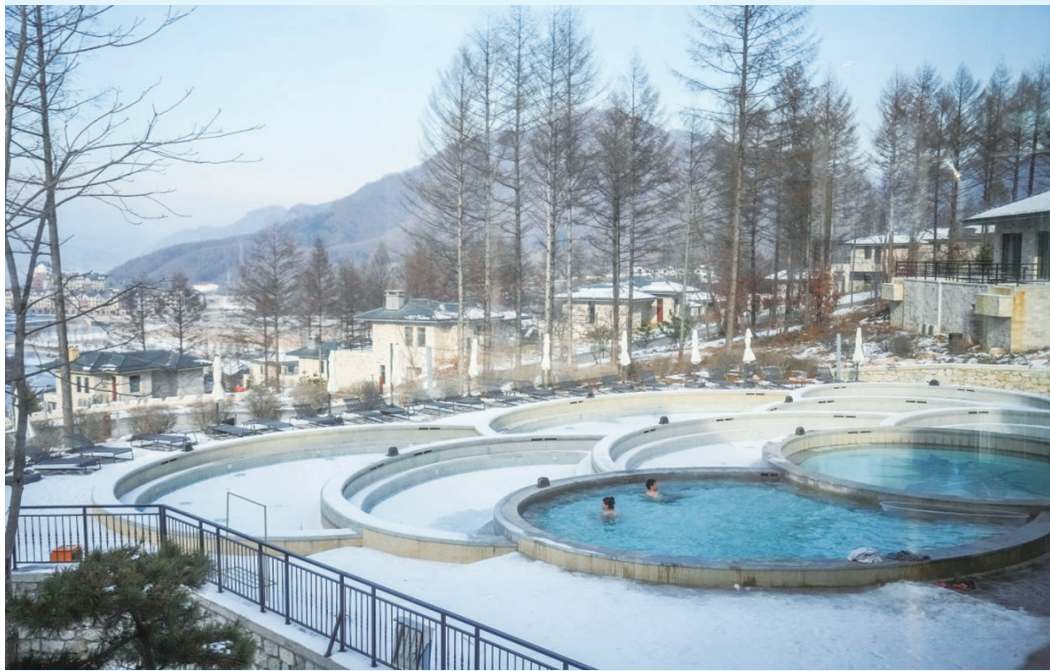
12月10日,游客在本溪市本溪县观山湖熙康云舍健康度假酒店体验室外温泉。

辽宁省本溪市温泉资源丰富,近年来,当地依托这些温泉资源,打造多处温泉度假区,冬季温泉游吸引不少游客前来体验。结合游客的游玩体验,本溪市进一步将温泉与滑雪、康养等旅游产品进行结合,在冰天雪地里打造独具特色的“热经济”。