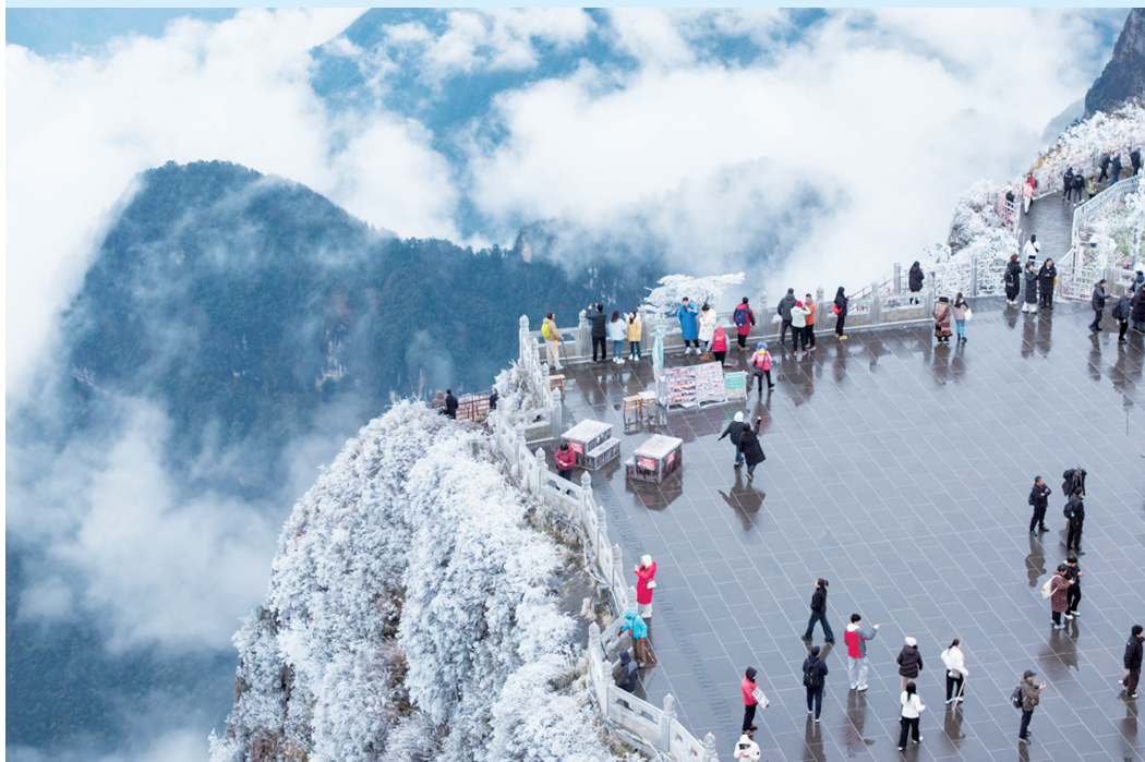
游客在峨眉山山顶远眺群峰与云海(11月20日摄,无人机照片)。