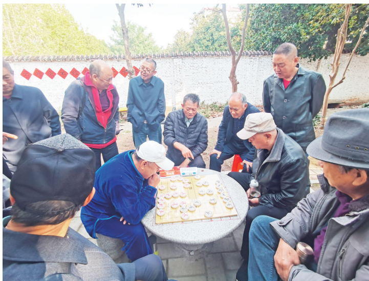
象棋比赛现场

本报讯(尹浩)10月25日,在彩虹桥西侧浉河北岸运政小区家属院旁平遥棋社同时上演了两件大事,得到了我市象棋爱好者的广泛参与和关注,信阳市象棋协会全民健身活动示范点平遥棋社揭牌和2024年中国体育彩票全国象棋民间棋王争霸赛(河南赛区)信阳市级赛同步开展。