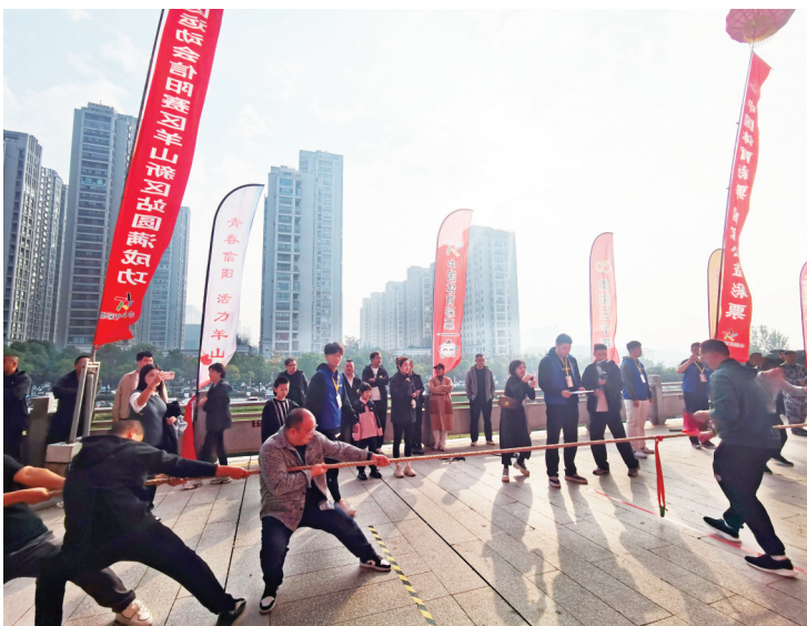
拔河比赛现场

家公益彩票”的发展目标,为体育强国及健康中国建设持续注入体彩力量!截至当前,中国体育彩票共筹集公益金超8600亿元,用于体育事业和社会公益事业发展。大力开展全民健身活动,促进人民群众