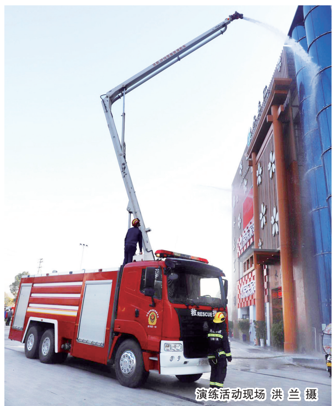
演练活动现场

本报讯(洪兰)“报告,三楼衣物储存间发生火情,有群众被困!”接到工作人员上报后,水乐汇开启事故应急广播,紧急疏散就近群众,调派微型