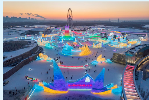
1月3日拍摄的夕阳下的第24届哈尔滨冰雪大世界园区(无人机照片)。

“随着疫情防控政策进一步调整,人们出游意愿将逐渐提高,各地发展旅游的积极性高涨。”戴斌说,特别是随着北京冬奥会的成功举办,冰雪旅游、冰雪竞技、冰雪运动、冰雪休闲的群众基础越来越广泛,冰雪产业相关投资和研发也越来越多,有望实现新突破。(据新华社)