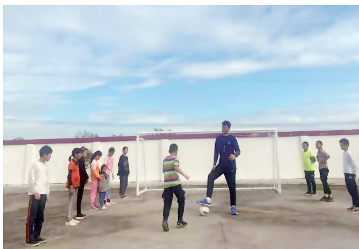
▲ 常成在给孩子们上体育课