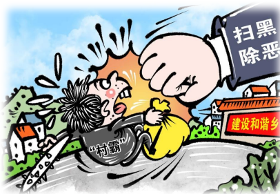
重拳打击“村霸” 新华社发 商海春 作

政法机关还将加大食品药品、生态环境、公共交通、安全生产等领域执法司法力度,推动民法典深入贯彻落实,加强涉及人身权、财产权、人格权特别是个人信息保护等领域的执法司法工作。