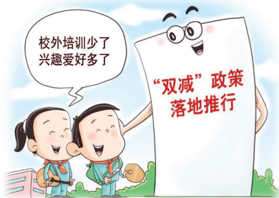
变化 王鹏 作

交通出行也将更方便。全国交通运输工作会议提出,加快建设高质量综合立体交通网,加强出行服务无障碍、适老化、人文建设,深化电子不停车收费系统(ETC)服务提升。(据新华网)