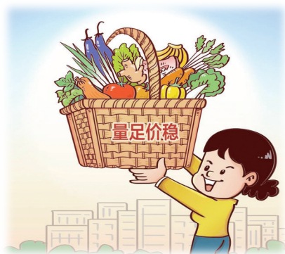
民生所盼 新华社发 郭德鑫 作

对消费体验不满意?别担心!2022年,中国消费者协会将重点围绕新能源汽车、网络游戏、校外培训、老年消费、未成年人消费、残疾人消费、农村消费、个人信息保护、预付式消费、公共服务消费等领域开展民生领域消费监督活动,开展不公平合同格式条款点评活动,完善消费舆情常态化监测、分析、处置、反馈机制。