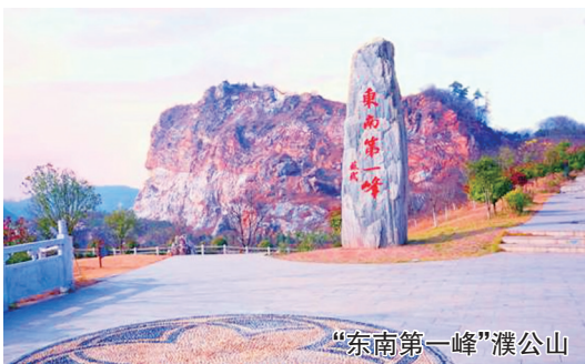
“东南第一峰”濮公山