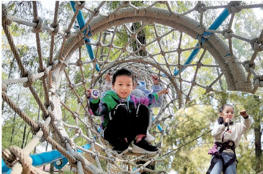
▲曲折吊笼,冒险和乐趣并存