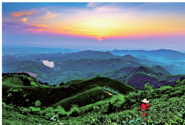
《日出西九华》