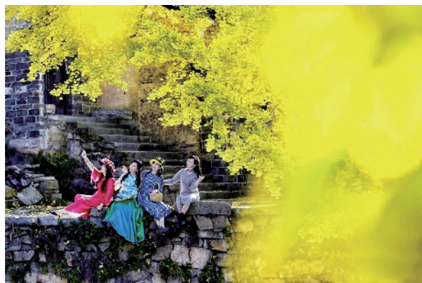
《秋景惹人醉》曹乃军 摄