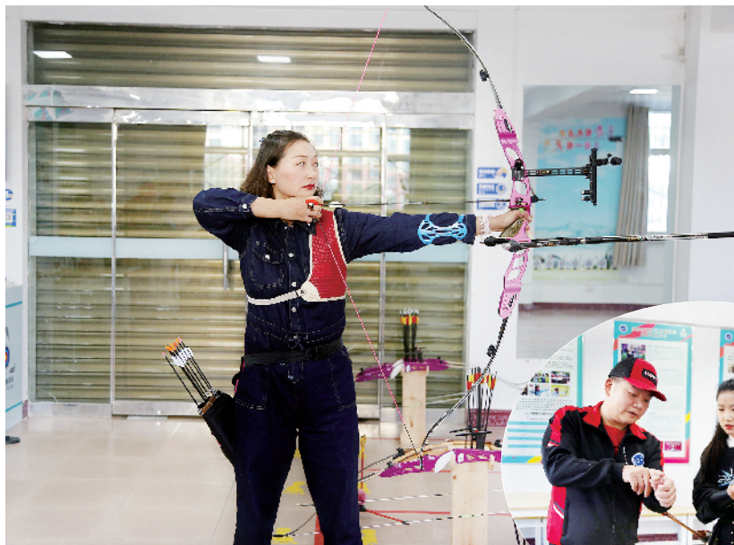
▲射箭爱好者日常训练