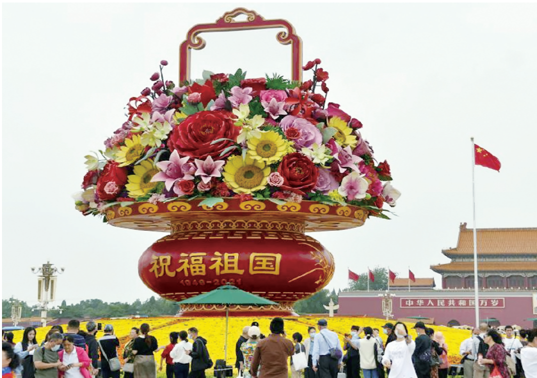
日前,天安门广场为迎接国庆节布置的“祝福祖国”主题花坛成为热门打卡地,每天吸引众多市民游客前来参观拍照。