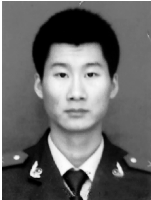
张良(资料图)