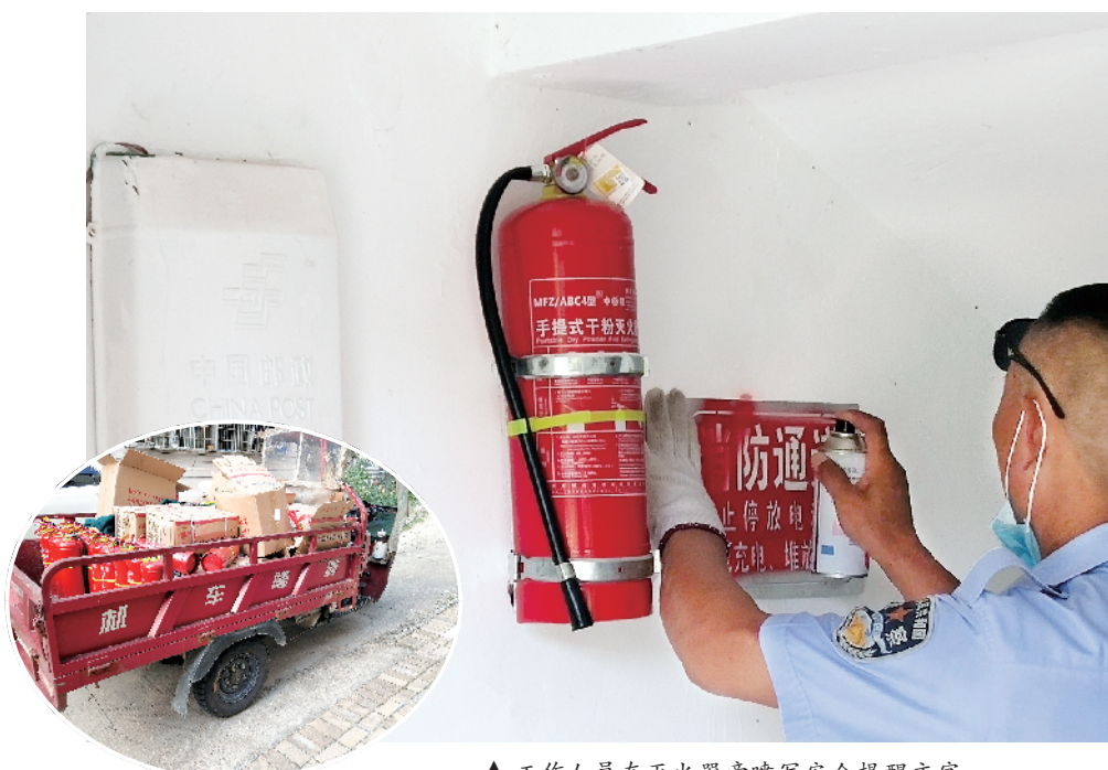
▲ 工作人员在灭火器旁喷写安全提醒文字 ◀ 运送灭火器的三轮车

本报讯(郭晓庆)消防安全是每个社区工作的重中之重,为使小区的消防安全得到更好的保障,有效预防和遏制火灾事故的发生,切实推进社区消防安全工作,7月13日至15日,浉河区五星街道宝石社区为辖区内无人管理小区及老旧小区共计三个小区统一安装了灭火器,筑牢安全“防火墙”,确保和谐、稳定的消防安全环境,保障社区居民的生命财产安全。