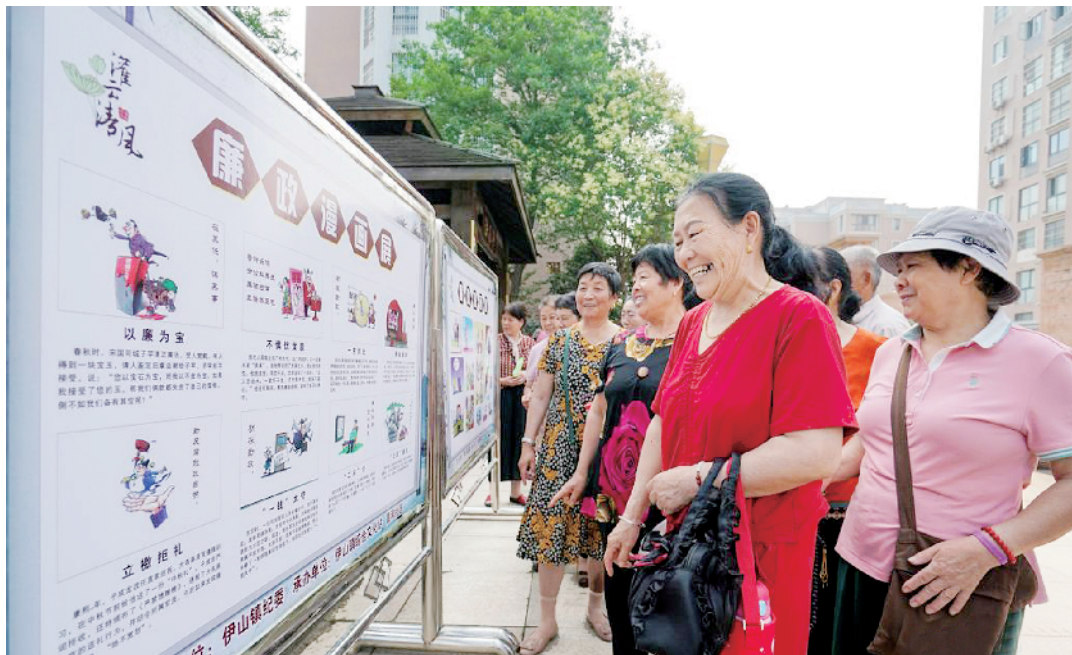
6月23日,江苏省连云港市灌云县昌和社区举行“廉政文化进社区”活动,通过廉政漫画展、发放宣传手册以及文化表演等形式宣传廉政文化,提高社区党员干部廉政意识,推动清廉文化在社区落地生根,让居民感受到风清气正的良好氛围。

丁薛祥、刘鹤、许其亮、张又侠、魏凤和,中央军委委员李作成、苗华、张升民参加通话活动。