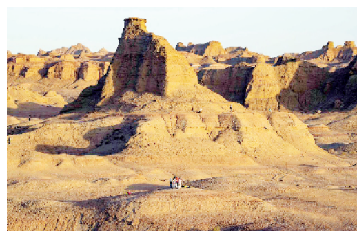
世界魔鬼城景区位于新疆克拉玛依市乌尔禾区,属于典型的雅丹地貌。盛夏时节,景区正值旅游旺季,壮美的风光令游客沉醉其中。