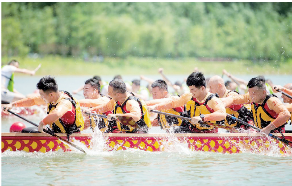
6月13日,在湖南省汨罗市屈子文化园举行的龙舟表演赛。

12日上午,伴随着震撼的鼓点,陕西安康市在汉江举行第二十一届龙舟节活动,呐喊声、锣鼓声在河面上回荡;在江苏连云港市连云区黄窝村,一条13米“长龙”上下飞舞、蜿蜒腾挪;在2021芜湖古城端午文化节上,众多市民、游客点亮河灯……端午假期,各地组织开展丰富多彩的文化活动。人们吃粽子、饮雄黄酒、插艾草、划龙舟,在乐享假日的同时,体悟传统民俗,感受文化魅力。