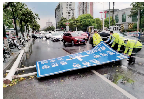
合力除障保通行