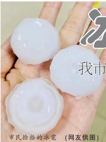
市民捡拾的冰雹

市气象局预测,今日我市还有中到大雨、局部有暴雨,并伴有雷电、短时大风、短时强降雨、冰雹等强对流天气,相关单位和部门以及广大人民群众应提前做好防范措施。