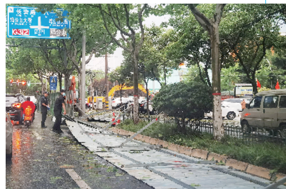
施工围挡被吹倒