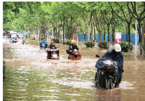
长安路严重积水

经过清理,树枝等障碍物被移至路旁,执勤民警、辅警则继续坚守一线维护交通秩序,全力保障雨天道路交通安全畅通有序,为群众安全出行保驾护航。同时,交警部门提醒雨天行车应注意减速慢行,保持安全车距,注意观察道路情况,提高安全意识,谨慎驾驶,安全出行。