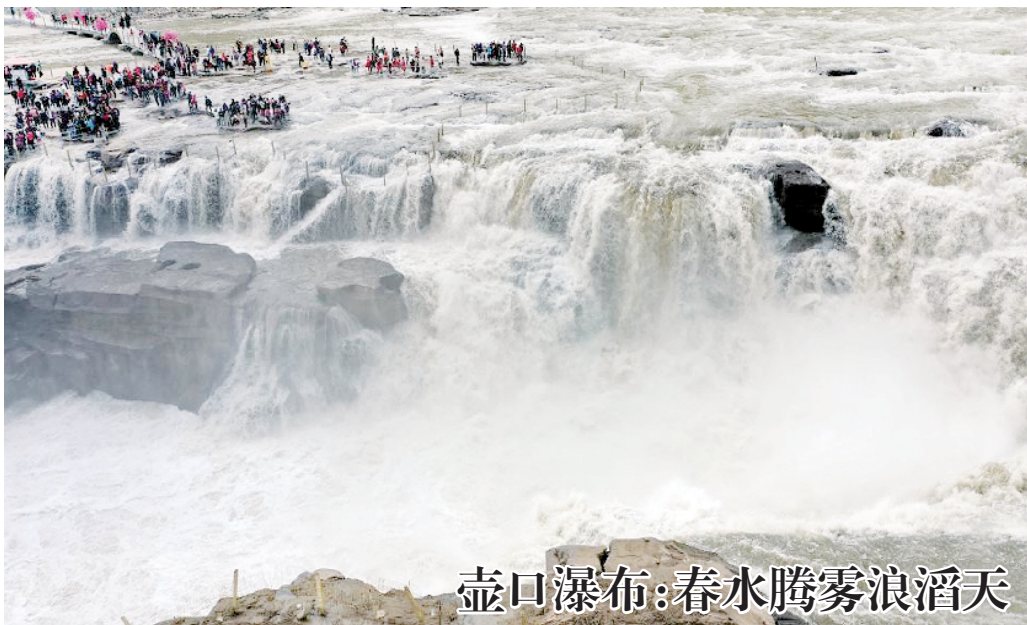
壶口瀑布:春水腾雾浪滔天

各省区市和计划单列市、新疆生产建设兵团分管教育工作负责同志,中央和国家机关有关部门、有关人民团体、中央军委机关有关部门以及部分行业协会、企业、高校、职业院校负责同志等参加会议。