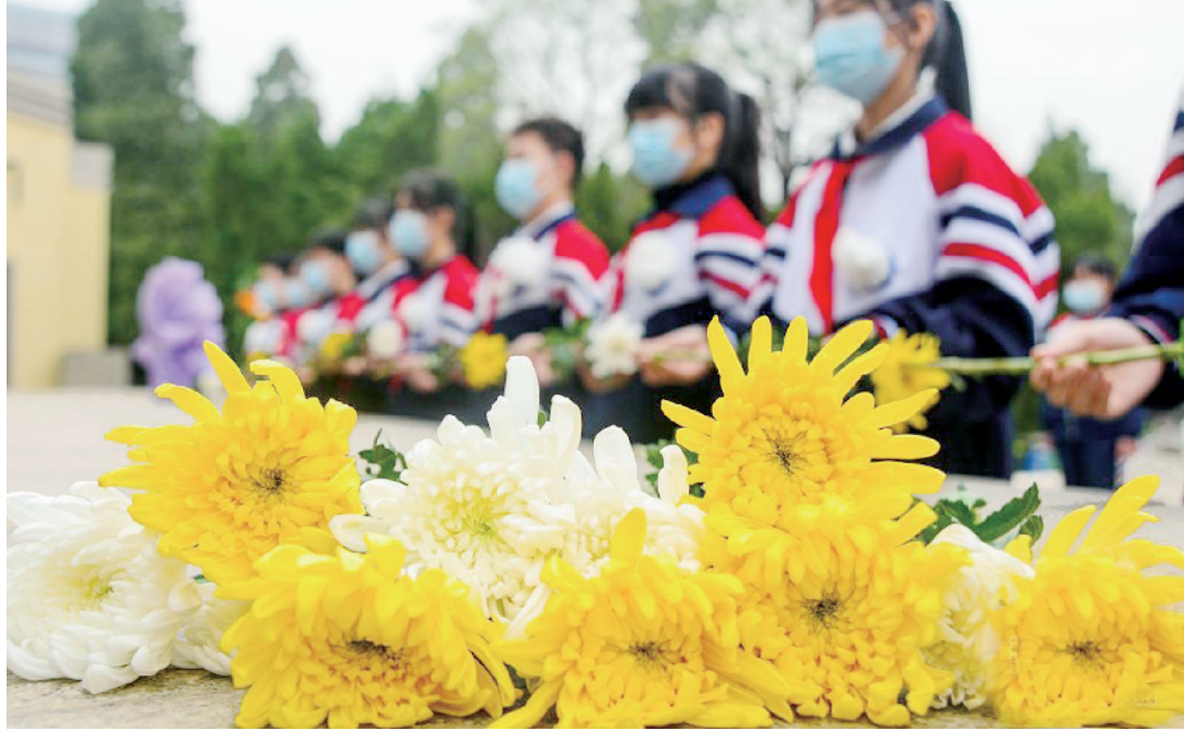
4月1日,在晋冀鲁豫烈士陵园,邯郸市邯山区农林路小学学生向烈士公墓献花。清明节前夕,河北省邯郸市邯山区农林路小学组织师生来到晋冀鲁豫烈士陵园祭奠烈士、缅怀先烈。