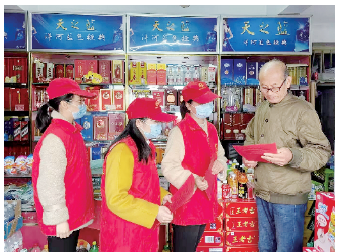
志愿者向辖区商户发放宣传手册

本报讯(平宣)清明节将至,为引导辖区群众文明祭祀,树立文明新风,促进生态文明,近日,浉河区五星街道平西社