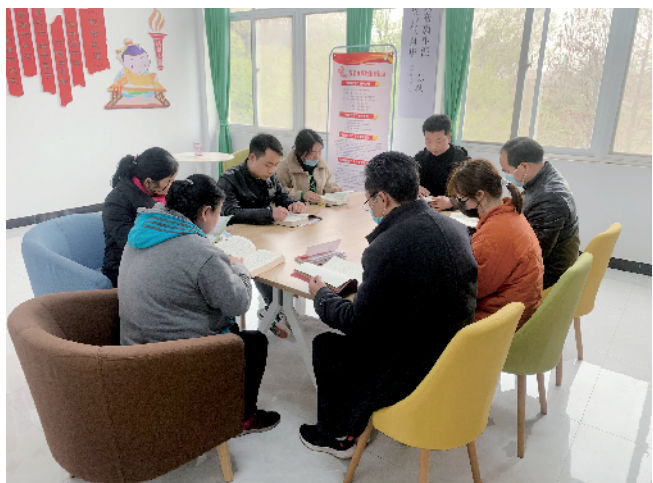
党员们正在阅读红色经典读物