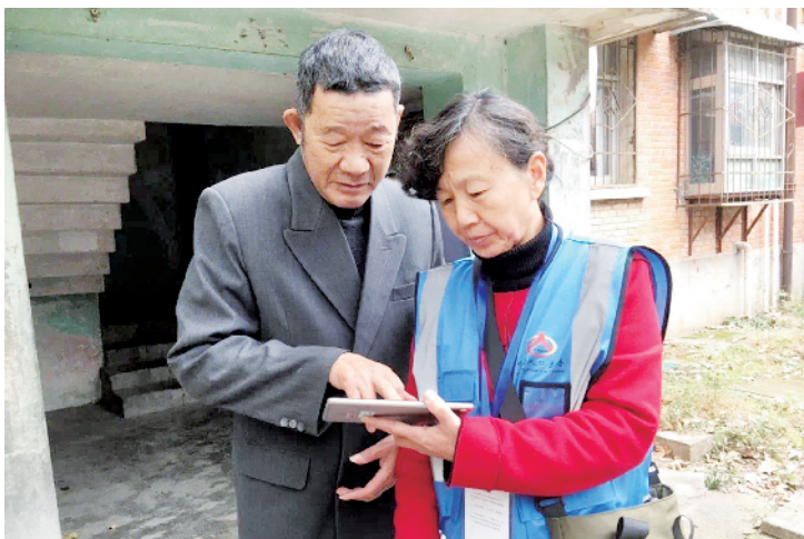
普查现场

本报讯(记者 李倩)昨日,记者从浉河区金牛山街道获悉,截止10日,金牛山街道已完成第七次全国人口普查登记工作,普查登记25218户,完成进度100%。