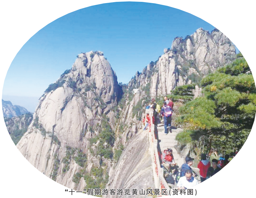
“十一”假期游客游览黄山风景区(资料图)

此外,各地运用高科技手段,通过预约、限流、导流等方式提高服务水平,提升了游客游玩体验。据统计,长假期间全国实行实名预约的景区数量增长了3.5倍,除部分开放式免票景区外,超过94%的5A级旅游景区实施分时预约制度。中国旅游研究院调查显示,长假期间82.8%的游客不同程度体验了预约,仅有2.5%的游客对预约体验表现出负面评价。