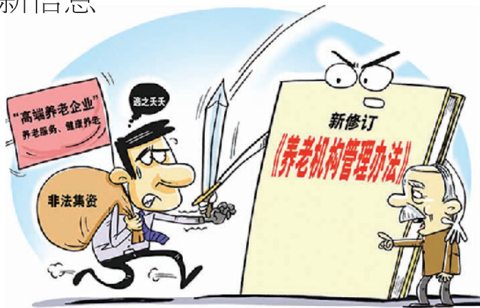
斩断黑手 新华社发 王鹏作

“需要说明的是，备案不是审批式或变相审批式备案，而是告知和承诺式备案。”俞建良表示，举办者通过备案向主管部门告知举办养老机构，并承诺具备养老机构服务能力和信用保证，