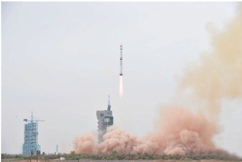
发射现场

新华社酒泉9月21日电 (李国利 朱霄雄)9月21日13时40分,我国在酒泉卫星发射中心用长征四号乙运载火箭,成功将海洋二号C卫星送入预定轨道,发射获得圆满成功。