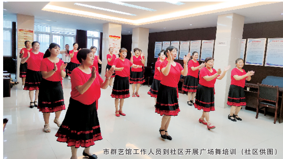
市群艺馆工作人员到社区开展广场舞培训

我们业余生活呀。”在采访过程中,几位来社区办事的居民纷纷向记者表示,社区活动开展得很是丰富多彩。