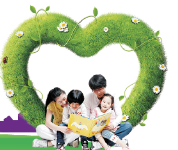
责编:王洋 创意:金霞 质检:尚青云