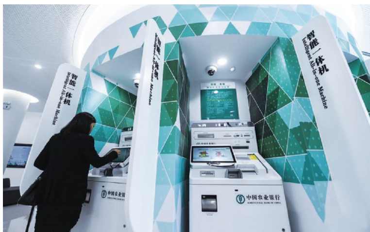
市民在互联网智慧银行智能一体机上自助办理业务。

有没有发现身边的银行网点越来越少?7月11日,记者查阅银保监会金融许可证信息平台发现,今年上半年(2020年1月1日-2020年6月30日)已经有1318家商业银行分支机构宣布关张,7月1日-7月3日又有63家网点退出市场。