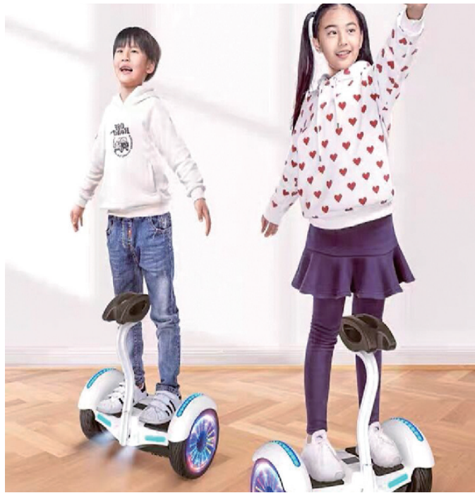
淘宝网上,部分商家电动平衡车展示图

另一个值得重视的现象是,事故发生时,很多骑行者没有佩戴任何护具。北京儿童医院顺义妇儿医院官网披露,5月某一晚,该院综合外科朱医生在值班期间接待4位骑行电动平衡车导致摔伤来急诊的儿童,年龄最小的只有4岁,最大的也才10岁,没有一个儿童