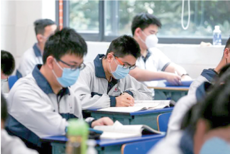
5月6日,武汉市第二中学高三学生戴着口罩上课。

1月15日,教育部公布《关于在部分高校开展基础学科招生改革试点工作的意见》。明确2020年起,在部分高