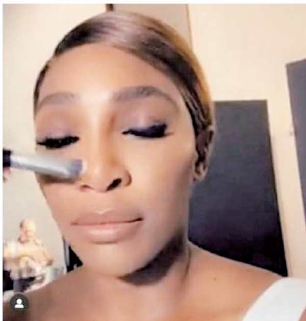
图为小威变身美妆博主

赛事停摆、球场关闭,世界体坛因疫情按下暂停键。宅家也是“战疫”的一种,有些人在家埋头苦练,保持状态;也有些人利用自身影响力,助力“抗疫”。面对疫情,世界体育明星们都在行动,各种“花式抗疫”成为另一道风景线。