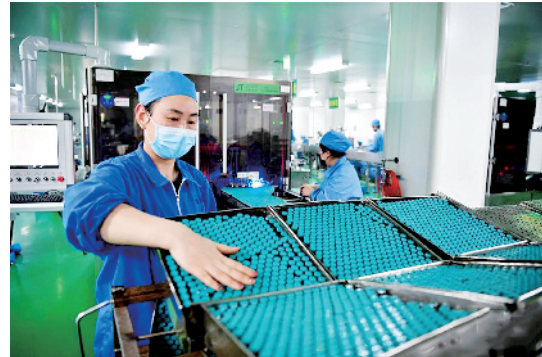
近日,位于河南省南阳市淅川县的福森药业响应疫情防控的号召,在强化厂区消毒和人员防护的同时,组织工人复工复产,提升药品产量。图为2月20日,工人在福森药业制药车间内忙碌。