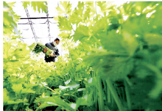
当前,河北省结合各地冬春蔬菜生产特点,统筹安排产品结构和产销布局,力争让“菜篮子”产品产得出、运得走、供得上。图为昨日,河北滦州市小马庄镇西晒甲坨村的农民在大棚内收获芹菜。