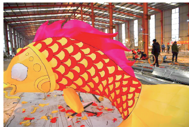
春节临近,在湖北省恩施土家族苗族自治州宣恩县,近百名彩灯制作工人加紧制作、调试大型彩灯组,迎接新春佳节。