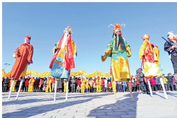
连日来,甘肃张掖甘州区靖安镇的社火表演队队员们加紧排练,准备在春节期间为广大市民呈现精彩的表演。