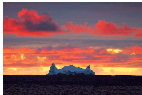
中国第36次南极考察队在南大洋宇航员海进行综合科考期间,不时遇到形态各异的冰山,它们是南大洋上的靓丽风景。