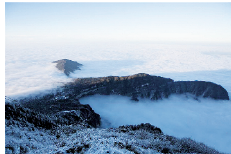
时值冬日,峨眉山银装素裹,宛如仙境。