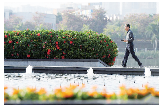
冬日, 广西南宁绿树成荫, 鲜花绽放, 景色宜人。图为市民从南宁市南湖边绿树鲜花间走过。