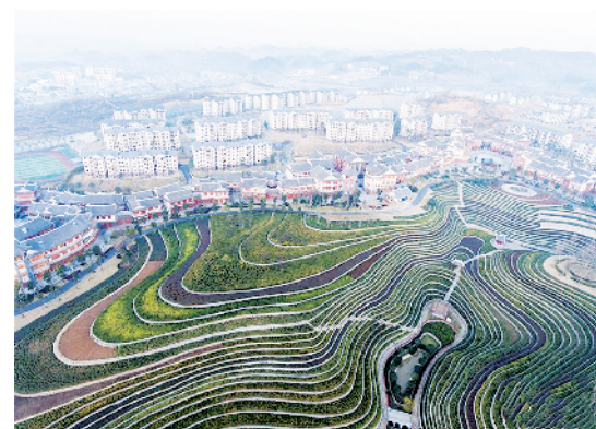
寒冬时节, 贵州省毕节市大方县奢香古镇的“城市梯田”绿意盎然, 层层叠叠、线条分明。大方县奢香古镇是该县易地扶贫搬迁安置区, 近年来在规划时把田园风光带入城镇建设, 在古镇中心建设了 12 万平方米的“城市梯田”, 种植观赏茶树、玫瑰花等观赏类植物, 既扮靓了移民小区, 又美化了城镇。