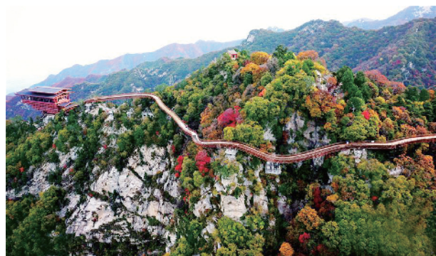
少华山位于陕西省渭南市华州区,因与西岳华山峰势相连,遥遥相对,但低于华山,因此得名少华山。少华山自古以来就是关中名山,自然景观和人文资源丰富,进入深秋,少华山满山的林木,更是五彩缤纷,绚烂美丽。