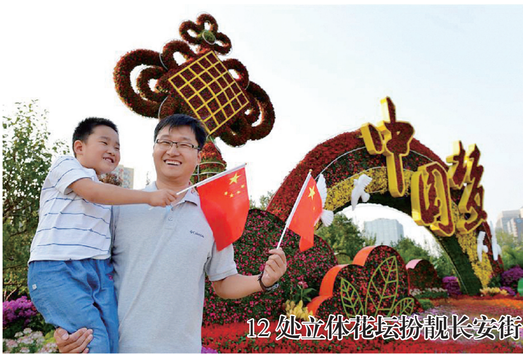
12处立体花坛扮靓长安街

为了迎接中华人民共和国成立70周年,北京长安街沿线的12处立体花坛近日竣工,正式与市民见面,绚丽多姿、造型多样的花坛吸引了众多市民观赏。