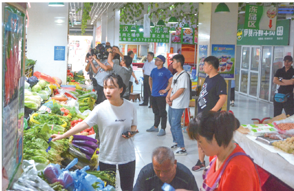
在农贸市场进行拍摄

信阳消息(尹安伟) 8月2日至3日,国家市场监督管理总局在信阳市组织拍摄纪念12315投诉举报热线建立20周年暨12315“五线合一”专题宣传片的部分片段场景期间,我市市场监管局积极配合、全力支持,多角度展现了市市场监管局谋划在先,切实加强机关办公环境和队伍作风建设、快速稳妥推进机构改革、加快队伍整合业务融合、全面推进市场监管、全力维护消费者合法权益、整体提升部门服务和监管效能,全场拍摄取得圆满成功。