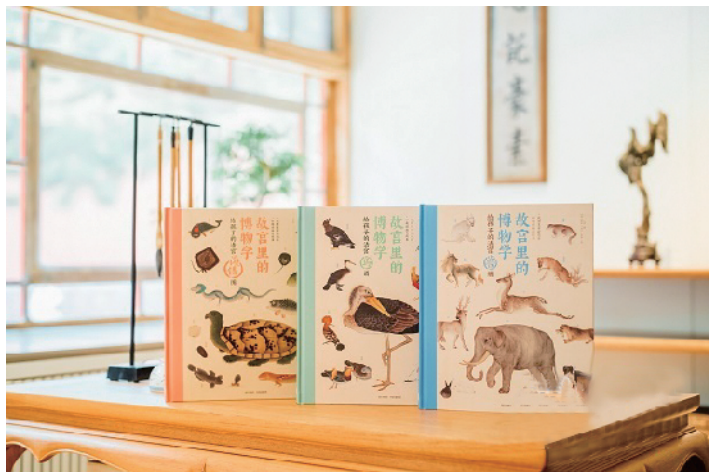
《故宫里的博物学》丛书 (资料图)

近日,由故宫出版社和中信出版集团联合打造的儿童科普读物《故宫里的博物学》在京正式发布。本书由清代乾隆时期宫廷收藏的动物图鉴《兽谱》《鸟谱》和《海错图》为蓝本编辑而成,被誉为中国版的“神奇动物在哪里”。