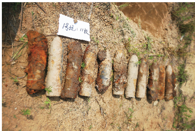
1号爆坑放入11枚炮弹

“请大家按照分工各就各位……”7月19日上午，淮河边一指定废旧弹药销毁点，30余名市公安局治安支队排爆民警与爆破公司工作人员整装待发，准备销毁日前于胜利路学校施工工地发现的104枚战争遗留炮弹。