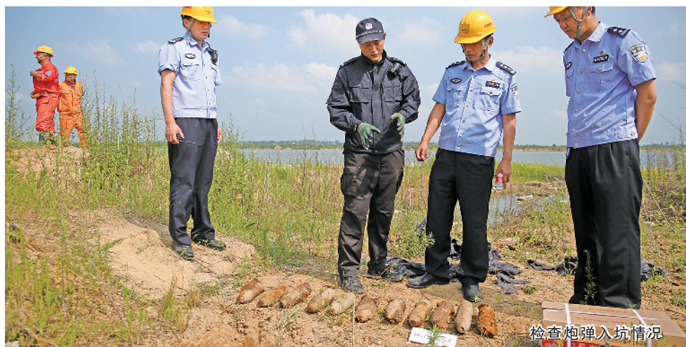
检查炮弹入坑情况