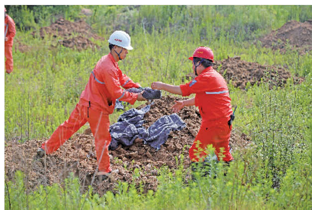
接过炮弹放入坑中