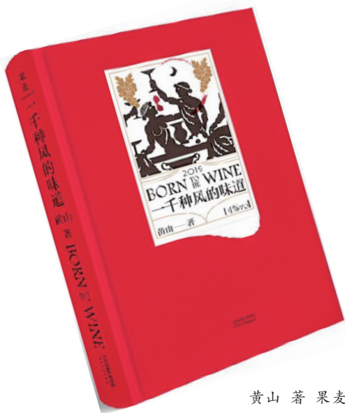
黄山 著 果麦文化出品

2019年6月5日,品酒师黄山女士携长篇小说《一千种风的味道》在北京由新书店与读者见面。知名出版人路金波、演员赵子琪、作家曾焱冰作为嘉宾出席了活动。