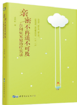
《亲密不再遥不可及》 易春丽著 世界图书出版公司

这本书虽然是自闭症儿童的治疗实录,但行文非常流畅,文字细腻,过程详实,充满温情,读来宛如一本亲子关系的小说般身临其境。书中内容贴近日常生活,谈到了很多育儿的共性话题,比如,如何解读孩子的非言语行为、孩子不听话为什么以及怎么办等,在很多关键的互动节点上,作者都清晰地点名了其行为背后的关键性思考。而这些关键性的思考,正是所有期待加强亲子关系互动的家长们非常需要而又平时所忽略的。