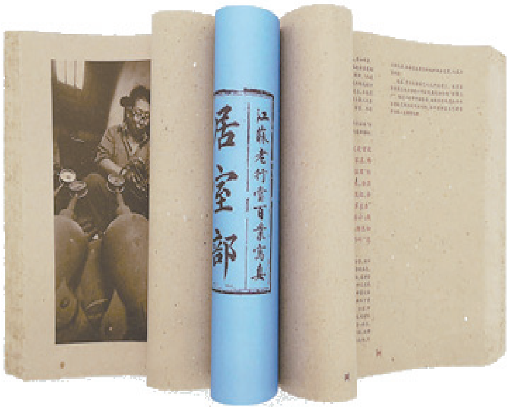
图为获奖书籍《江苏老行当百业写真》。

记者从上海市新闻出版局获悉,2019“世界最美的书”评选近日在德国莱比锡揭晓,其中由上海市新闻出版局、“最美的书”评委会选送的《江苏老行当百业写真》荣获“世界最美的书”荣誉奖。