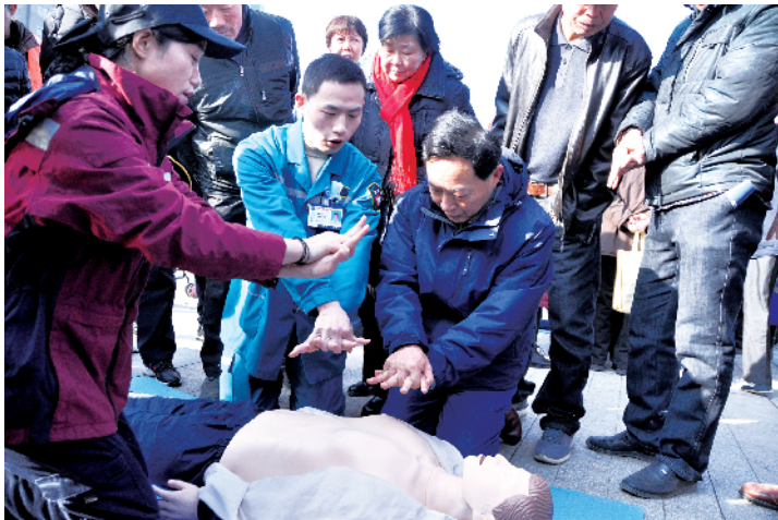
急救人员现场教授市民医疗救护知识

此次活动以“全民反恐,守护平安”为主题。活动现场通过摆放宣传展板、悬挂宣传标语、设立咨询台、展示反恐装备、教授医疗救护知识、发放《公民预防恐怖活动行为指引》、播放“公民反恐视频宣传系列短片”等多种形式,宣传了反恐防范知识。活动现场,共向群众发放宣传资料23000余份,解答群众咨询