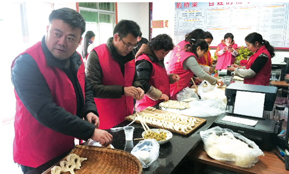
为营造邻里互助、团结友爱、温馨和谐的社区氛围,在寒冷的冬季社区孤寡老人、困难群众送去温暖,12月14日上午,浉河区马鞍社区联合共建单位市交通运输局组织志愿者开展“爱在冬天 情暖社区”志愿服务活动。图为志愿者为社区孤寡老人和困难群众包饺子。

通过此次道岔除雪演练,加强了职工行车安全意识,提高了全体职工在冬季遇到险情等突发事件时的应急处理能力,促进了冬季列车及调车作业的安全运行。