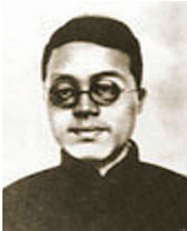
陈寿昌像(资料照片)