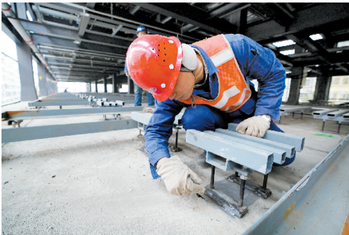
工人正在进行着最后的收尾工作

在申碑路立体停车场项目建设现场,记者看到,立体停车场已经竣工,工人们进进出出,都在紧张的忙碌着收尾工作。“这个立体停车场可以停放270